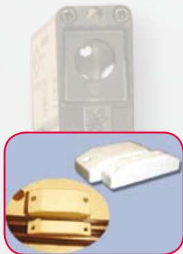
Protection des vitrines par contacteurs magnétiques

Notre système évolutif s'adapte harmonieusement à tous les environnements.