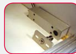
Protection des vitrines par verrous électromagnétiques