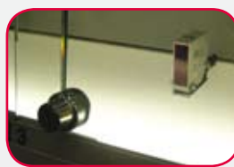
Protection des vitrines par cellule photo électrique